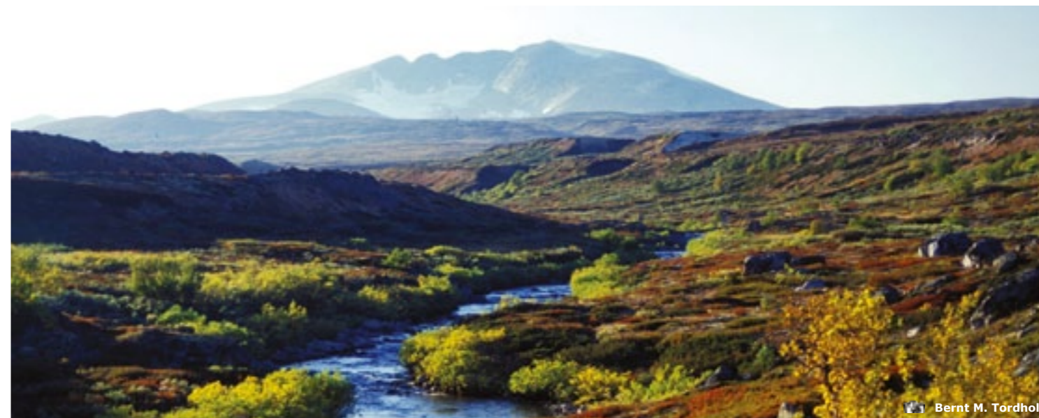
Bernt M. Tordhol

Die E6 ist die Hauptroute zwischen dem Norden und dem Süden Norwegens und läuft auch durch Oppland. Die E16 und die E136 sind die Hauptverbindungslinien zwischen dem Osten und dem Westen.